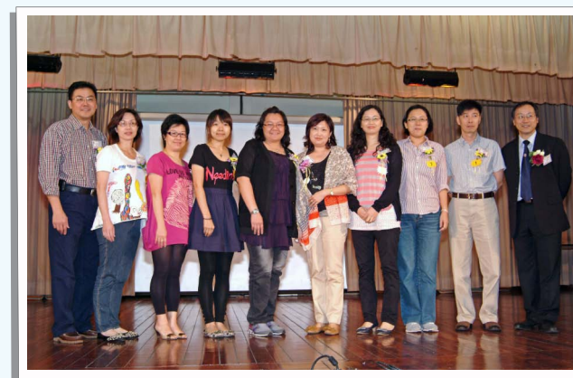
家長委員與校長合照